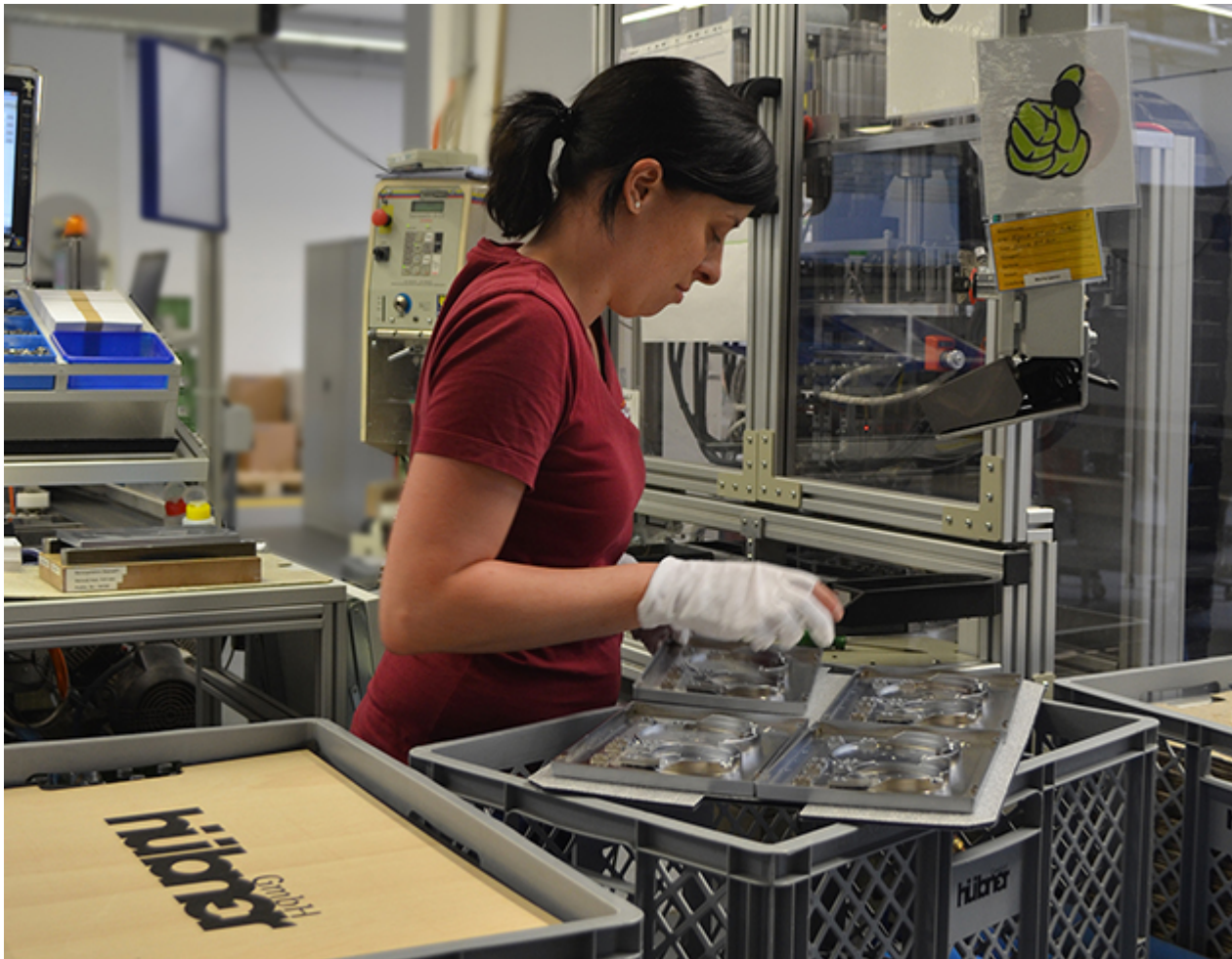
Bedienen der Nietanlage bei C. Hübner GmbH

Die Firma C. Hübner GmbH ist ein mittelständisches und familiengeführtes Unternehmen mit Sitz in Marktoberdorf. Über die ISO zertifizierte Prozesskette werden mittels Kunststoffspritzguss und Kunststoffgalvanik hochwertig veredelte Komponenten für die Automobilindustrie, den Sanitär- oder Konsumentenbereich hergestellt.