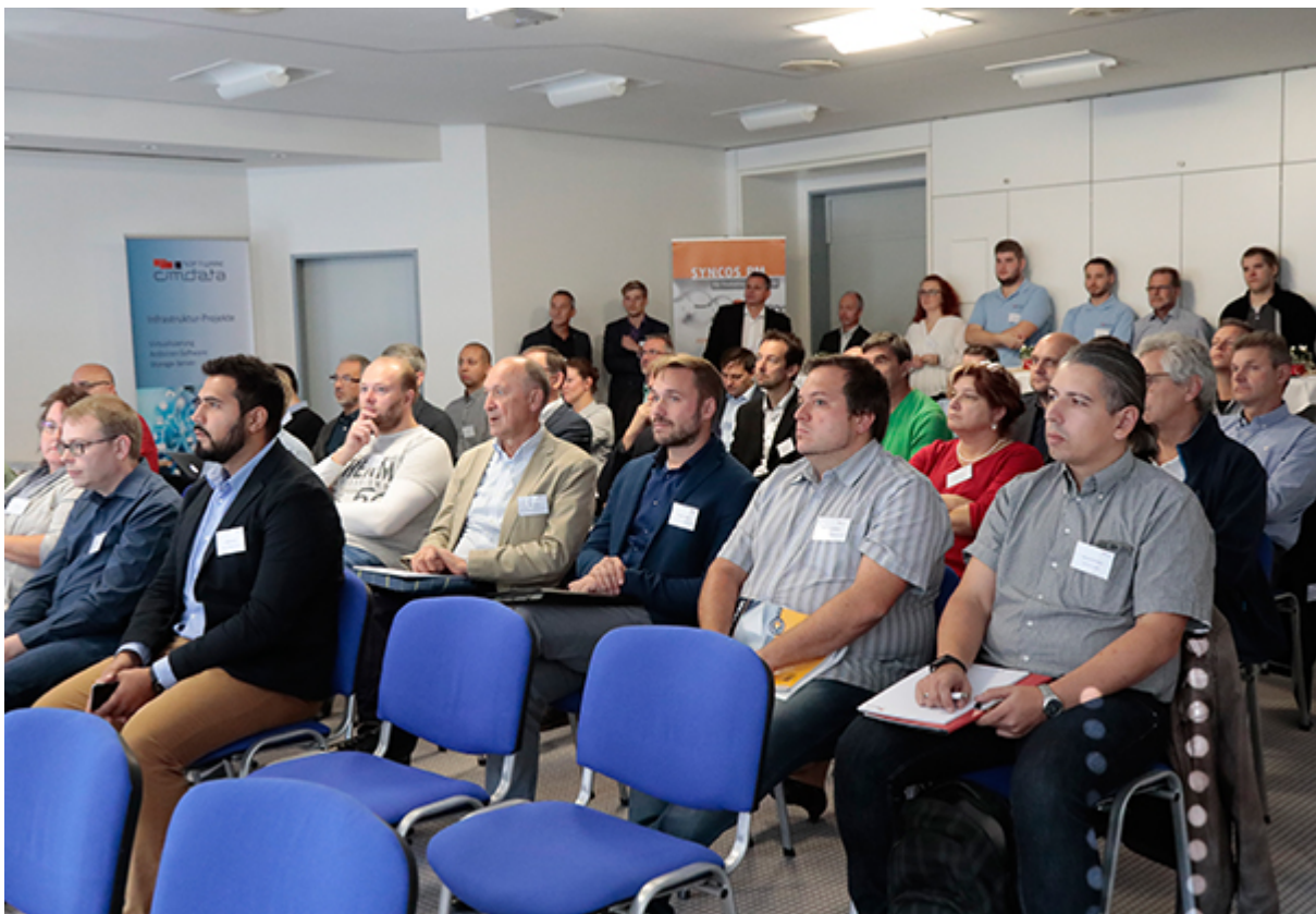
Informative Vorträge am IT Forum 2018